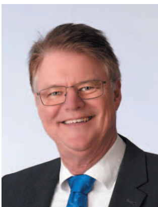
Ihr 1. Bürgermeister Otto Klaußner

In diesem Sinn darf ich Ihnen, liebe Mitbürgerinnen und Mitbürger, im Namen des Gemeinderates und der gesamten Gemeindeverwaltung sowie ganz persönlich ein frohes und friedliches Weihnachtsfest wünschen.