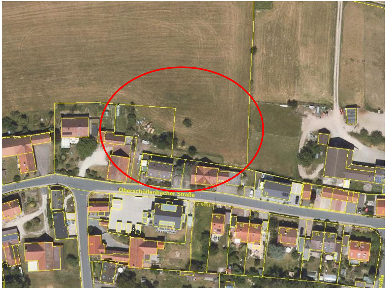
Luftbildkarte des Geltungsbereichs

Der Einbeziehungsbereich schließt direkt an die im Zusammenhang bebauten Flächen an. Er ist durch die bauliche Nutzung angrenzender Flächen so geprägt, dass sich die künftige Bebauung gem. § 34 BauGB in die Eigenart der Umgebung einfügen lässt. Die Umgebung hat eine gemischte Struktur mit Wohnhäusern und landwirtschaftlichen Gebäuden. Die Prägung durch die bisherige bauliche Nutzung nach, Art, Maß und Bauweise und überbaubaren Flächen wird aufgenommen.